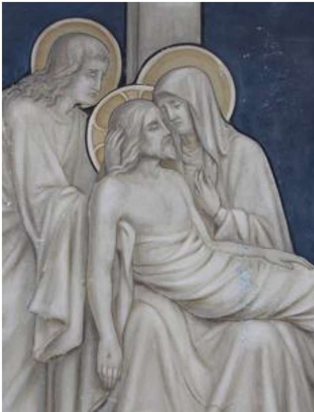
Uitsnede XIII-statie ‘Jezus wordt van het kruis afgenomen’